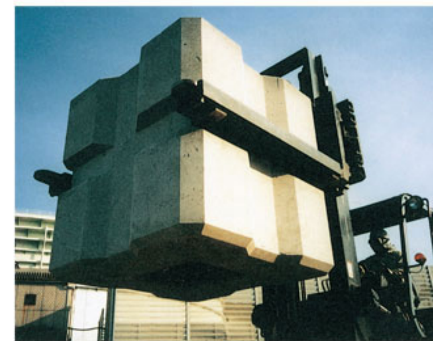
ブロックの製造 重量：約6t 寸法：1.6m×1.6m×1.6m

（社）マリノフォーラム21の沿岸漁場造成技術開発研究会の「マウンド漁場造成システム開発」で、石炭灰を多量に使用したブロックを大量に沈設しマウンドを造成し、人工湧昇流漁場を構築する技術が開発され、実用化されています。