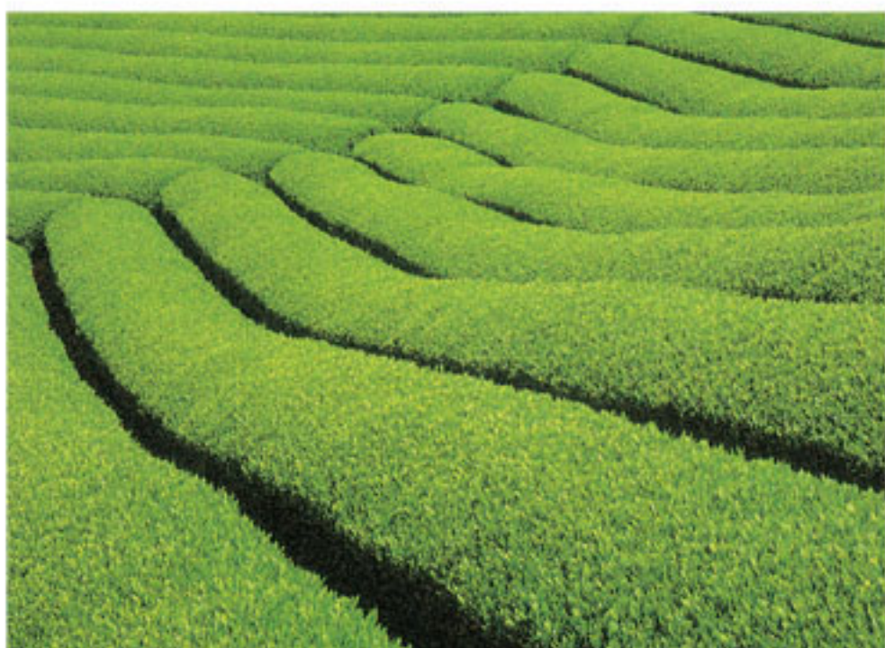
写真はけい酸加里肥料を使って収穫された作物の一例です。