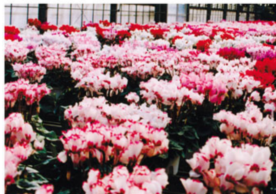
シクラメンの栽培の様子

クリンカアッシュに、火力発電所の水路から発生する貝がらの粉末および水力発電所のダムにたまった流木や伐採木からつくった堆肥等を加えた透水性、保水性、通気性および保肥力に優れた園芸用の培養土が商品化されました。